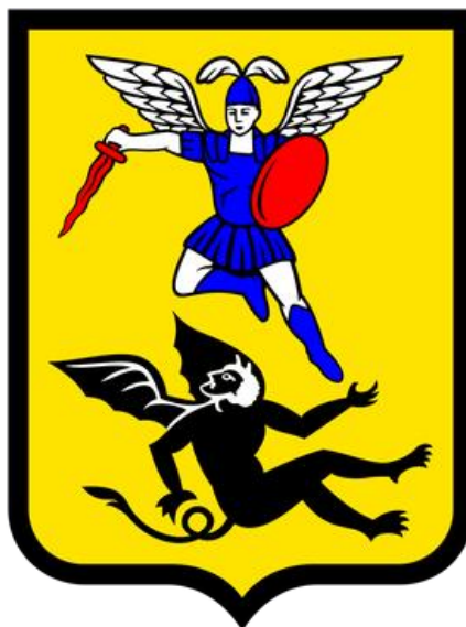
Схема теплоснабжения городского округа «Город Архангельск» до 2040 года